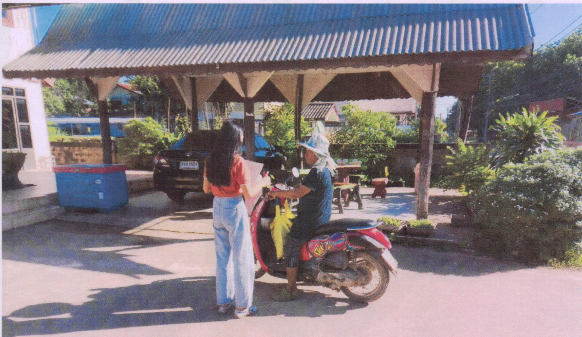
ภาพที่ 5.4 ทีมงานนักวิจัยลงพื้นที่แจกแบบสอบถามในเขตเทศบาลตำบลนากลาง อำเภอนากลาง (3)

กล่าวคือ ผลการสำรวจความพึงพอใจของประชาชนผู้รับบริการของเทศบาลตำบลนากลาง อำเภอนากลาง จังหวัดหนองบัวลำภู (ประจำปีงบประมาณ 2564) กลับพบว่า ประชาชนผู้รับบริการมีความพึงพอใจงานด้านสาธารณสุขมากที่สุด ร้อยละ 95.80 หมายถึง ประชาชนผู้รับบริการพึงพอใจมากที่สุด (เกณฑ์คะแนนที่ได้คือ 10 คะแนน) รองลงมา ความพึงพอใจงานด้านการศึกษา ร้อยละ 95.70 หมายถึง ประชาชนผู้รับบริการพึงพอใจมากที่สุด (เกณฑ์คะแนนที่ได้คือ 10 คะแนน) ความพึงพอใจงานด้านพัฒนาชุมชนและสวัสดิการสังคม ร้อยละ 95.59 หมายถึง ประชาชนผู้รับบริการพึงพอใจมากที่สุด (เกณฑ์คะแนนที่ได้คือ 10 คะแนน) และความพึงพอใจงานด้านโยธา การขออนุญาตปลูกสิ่งก่อสร้าง ร้อยละ 95.42 หมายถึง ประชาชนผู้รับบริการพึงพอใจมากที่สุด (เกณฑ์คะแนนที่ได้คือ 10 คะแนน) ตามลำดับ