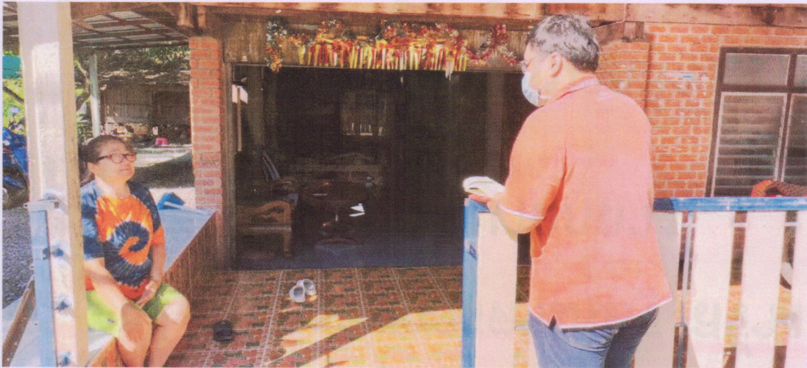
ภาพที่ 5.6 ทีมงานนักวิจัยลงพื้นที่แจกแบบสอบถามในเขตเทศบาลตำบลนากลาง อำเภอนากลาง (5)