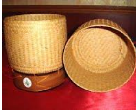
ข้อมูลการสานกระบุงข้าวจากปราชญ์ชาวบ้าน

ก่องข้าวหรือกระบุง เป็นภาชนะบรรจุข้าวเหนียวที่สร้างขึ้นโดยใช้วัสดุจากธรรมชาติที่หาได้ในท้องถิ่น ก่องข้าวหรือกระบุงมีข้อดีกว่าหม้อหุงข้าวและพาชนะพลาสติกสมัยใหม่ ตรงที่สามารถเก็บความร้อนได้โดยที่ ข้าวไม่เปียกหรือแฉะและไม่มีไอน้ำเกาะอยู่ ข้อแตกต่างมาจากเทคนิคการสานก่องข้าวและกระบุง สานให้ชั้นใน มีช่องให้ไอน้ำระเหยผ่านได้ ชั้นนอกจะสานทึบเพื่อกักความร้อน ซึ่งคุณสมบัตินี้จะทำให้ข้าวไม่ชื้นแฉะ และไม่ มีกลิ่นอับ